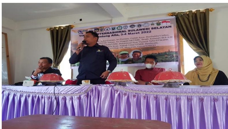
Gambar 2. Sosialisasi materi pariwisata Kecamatan Baroko, 2022

Dalam mendukung pengembangan pariwisata di Desa Alla, mereka yang berinisiatif lebih banyak melakukan pergerakan pada level struktural. Menariknya, hal ini diikuti oleh masyarakat karena mereka menaruh kepercayaan yang kuat kepada kepala desa. Melalui kelompok sosial yang dibentuk oleh kepala desa dan melibatkan masyarakat bergabung di dalamnya terutama kaum muda, maka pariwisata mulai memperlihatkan titik terang. Secara tidak langsung pemerintah kabupaten memang telah mencanangkan sejumlah wilayah sebagai titik potensi wisata dan pemerintah kabupaten serius untuk hal tersebut. Keadaan ini juga diperkuat oleh sejumlah perguruan tinggi yang melakukan kerja sama dengan pemerintah kabupaten sehingga menjadi faktor pendorong percepatan pariwisata tersebut.