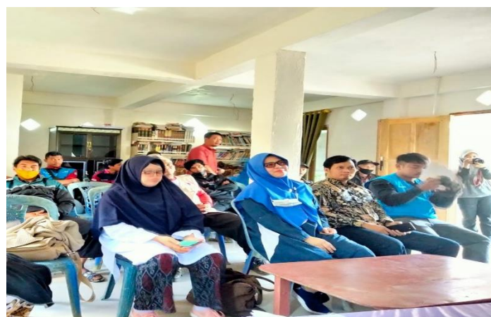
Gambar 3. Kegiatan inventarisir potensi wisata Kecamatan Baroko, 2022