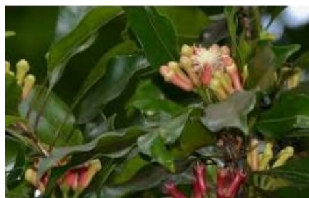
Gambar 1. Bahan Baku Minyak Cengkeh

Penyulingan minyak cengkeh di Desa Batu merupakan salah satu usaha unggulan yang dicanangkan oleh pemerintah daerah wajo saat ini. Hal ini disebabkan oleh tingginya permintaan akan minyak cengkeh