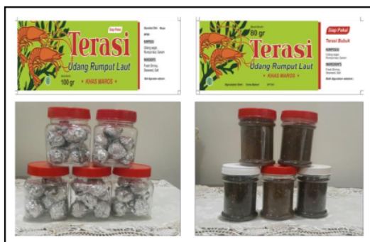
Gambar 2. Produk Terasi Udang Rumput Laut.

utama dari kegiatan ini adalah produksi terasi udang-rumput laut yang diproduksi dan dipasarkan oleh kelompok mitra. Produk dan kemasan dapat dilihat pada Gambar 2.