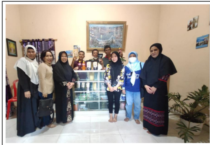
Gambar 3. Tim Pelaksana Bersama Mitra.

Setelah tahapan penyuluhan selesai, maka kegiatan pengabdian dilanjutkan dengan pelatihan pengolahan biji kopi menjadi kopi bubuk dengan menggunakan peralatan sederhana yang dimiliki oleh mitra. Selain itu, diperkenalkan juga berbagai peralatan lainnya yang lebih praktis dalam penggunaannya yang dapat digunakan oleh mitra dalam pengolahan biji kopi menjadi kopi bubuk.