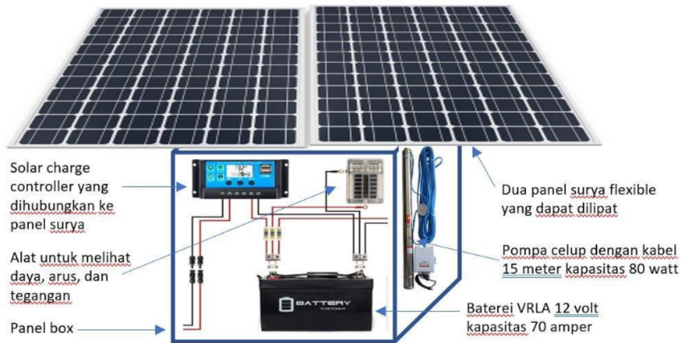
Gambar 1. Sistem Pompa Submersibel Berbasis Tenaga Surya

Selain melakukan pembuatan Pompa submersible DC DAN Konversi Air Berbasis Tenaga Surya juga dilakukan pendampingan kepada guru dan masyarakat sekitar agar mampu memahami dan menggunakan teknologi tersebut. Berdasarkan analisis terdapat peningkatan penguasaan mitra dalam memanfaatkan pompa submersibel dan konversi air berbasis tenaga surya. Berikut adalah tabel yang menggambarkan pengetahuan guru dan masyarakat (18 orang) tentang pompa submersibel dan konversi air berbasis tenaga surya