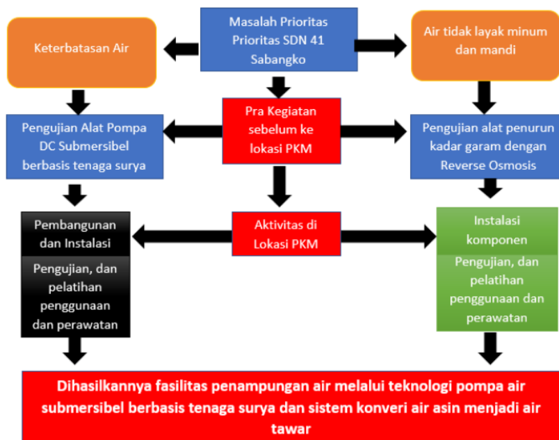
Gambar 1. Tahapan pelaksanaan kegiatan

Dalam program Pemberdayaan Berbasis Masyarakat ini dilakukan sesuai pada gambar dibawah ini: