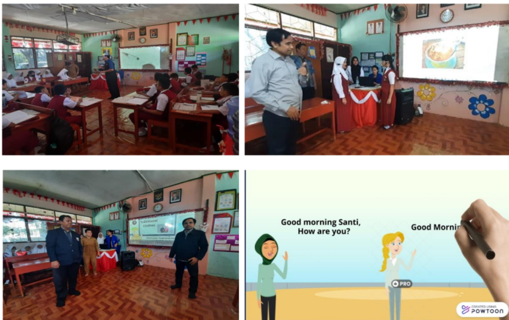
Gambar: Proses kegiatan PKM

Berdasarkan hasil percakapan yang di sajikan, para siswa menjadi tertarik dan termotivasi untuk belajar bahasa Inggris karena materi percakapan berdasarkan kebutuhan para siswa SD Inpres Manggala. Hal ini bisa di buktikan dengan hasil percakapan para siswa menjadi lancar karena siswa merasa termotivasi belajar bahasa Inggris dengan menggunakan model pembelajaran bahasa Inggris berbasis digital literacy sebagai upaya konstruktivisme karakter anak SD Inpres Manggala Makassar.