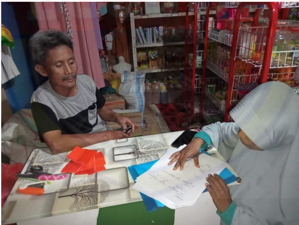
Gambar 2 : Wawancara dengan respon