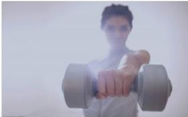
Gambar 4.8 Gym dan Pusat Kebugaran di Hotel Harper Perintis Makassar

Tetap Sehat di Gym Hotel kami. Pertahankan rutinitas olahraga Anda di pusat kebugaran lantai 1, gratis untuk semua tamu. Gym & Fitness Center buka mulai pukul 08.00 – 20.00.