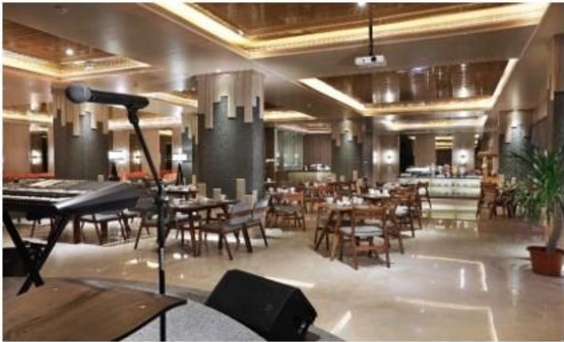
Gambar 4.6 RUSTIK Bistro & Bar