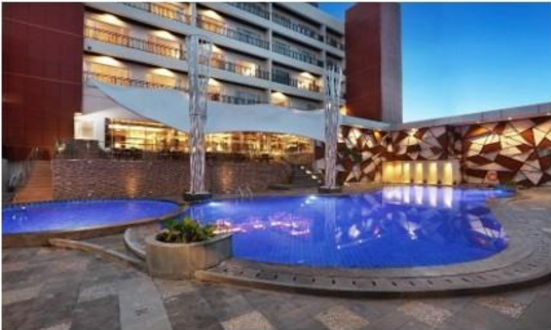
Gambar 4.5 Kolam renang ( Swimming Pool ) di Hotel Harper Perintis Makassar