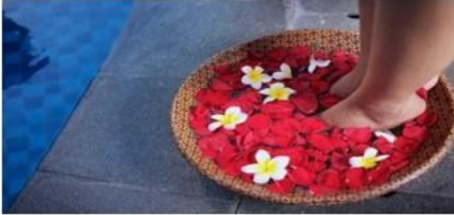
Gambar 4.7 ARTHA Spa di Hotel Harper Perintis Makassar