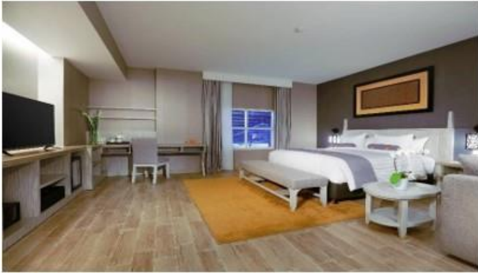
Gambar 4.3 Kamar tipe Suite Junior di Hotel Harper Perintis Makassar