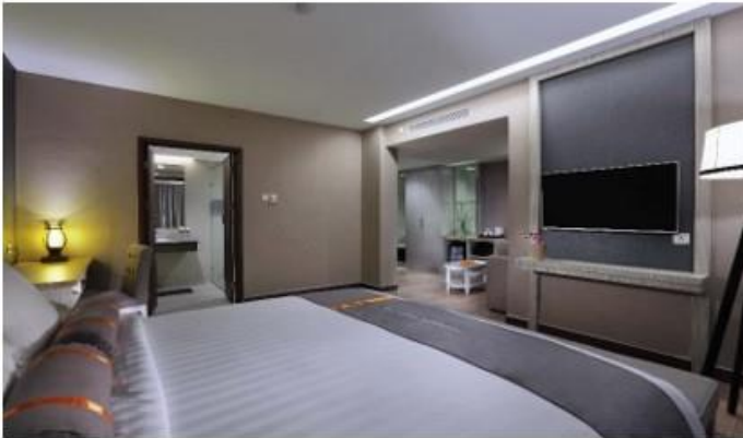
Gambar 4.4 Kamar tipe Suite Deluxe di Hotel Harper Perintis Makassar