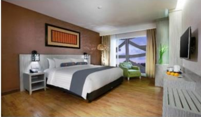
Gambar 4.2 Kamar Tipe Deluxe (Double&Twin) di Hotel Harper Perintis Makassar