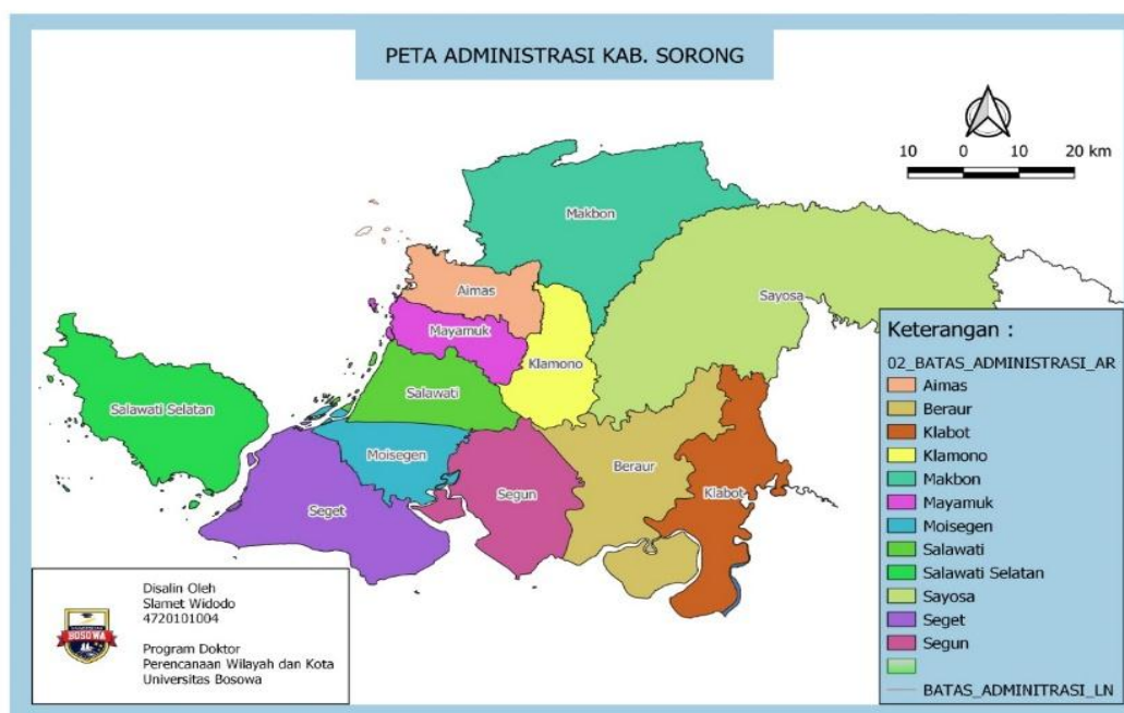
Gambar 1. Peta Administrasi Kabupaten Sorong