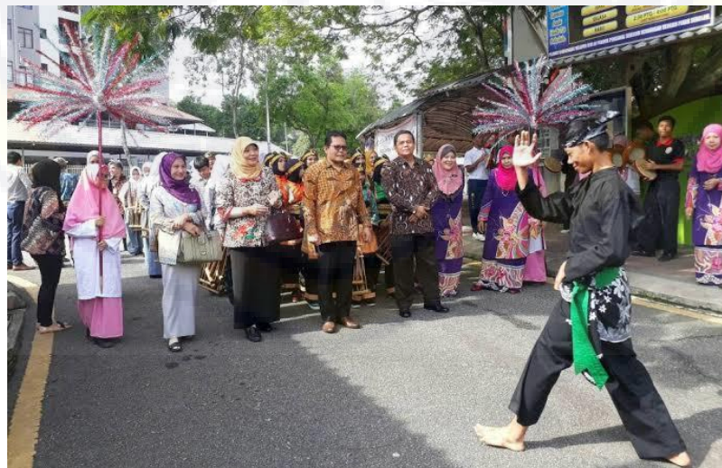
Foto penyambutan rombongan Atdikbud dan pihak Sekolah Sri Bintang Utara (SBU) Malaysia dalam acara Program Rumah Budaya Indonesia