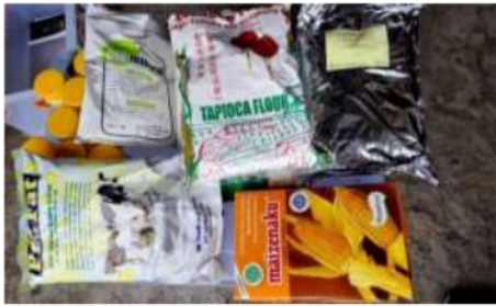
Gambar 3. Bahan Pembuatan Pakan Udang dan Ikan

Setelah semua alat dan bahan pelengkap disiapkan, kini saatnya membuat tepung Maggot yang akan menjadi bahan utama pembuatan pakan dan udang. Tepung ini terbuat dari Maggot BSF yang telah kering kemudian digiling menggunakan mesin penggiling agar teksturnya halus dan memudahkan saat pencampuran. Adapun Maggot BSF ini diperoleh dari hasil budidaya sendiri selama program Matching Fund Kedaireka Berlangsung.