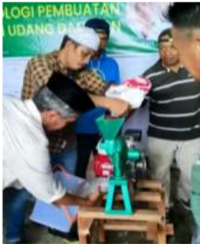
Gambar 4. Proses Penggilingan Maggot kering menjadi tepung

Setelah semua alat dan bahan pelengkap disiapkan, kini saatnya membuat tepung Maggot yang akan menjadi bahan utama pembuatan pakan dan udang. Tepung ini terbuat dari Maggot BSF yang telah kering kemudian digiling menggunakan mesin penggiling agar teksturnya halus dan memudahkan saat pencampuran. Adapun Maggot BSF ini diperoleh dari hasil budidaya sendiri selama program Matching Fund Kedaireka Berlangsung.