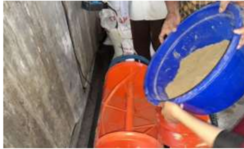
Gambar 6. Proses Pencampuran Bahan Menggunakan Mesin

Setelah semua bahan siap, saatnya pencampuran bahan menggunakan formula yang telah dibuat sebelumnya. Agar tercampur dengan rata, bahan-bahan tersebut dimasukkan ke mesin pencampur.