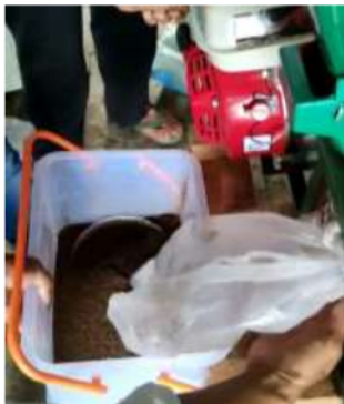
Gambar 5. Hasil Maggot yang Telah Digiling

Setelah semua bahan siap, saatnya pencampuran bahan menggunakan formula yang telah dibuat sebelumnya. Agar tercampur dengan rata, bahan-bahan tersebut dimasukkan ke mesin pencampur.