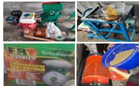
Gambar 2. Alat Pembuatan Pakan Udang dan Ikan

Sebelum pencampuran bahan dimulai, terlebih dahulu disiapkan alat dan bahan pembuatan pakan udang dan ikan.