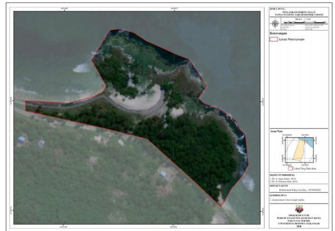
Gambar 2. Peta Delinisasi Lokasi Penelitian

jauh dari kebisingan kota dan juga nyaman untuk menikmati keindahan alam dan Pantainya. Tanjung Saruri atau biasa dikenal dengan sebutan Batu Pica, karena deburan ombak dari laut pasifik meghantam batu karang yang ada di bibir Pantai Tanjung Saruri dengan keras sehingga ombak yang dihasilkan pecah di batu karang dan hempasan ombak tersebut bisa mencapai ketinggian ±15 meter, oleh karena itu orang menyebu Obyek Wisata Tanjung Saruri dengan nama lainya adalah Batu Pica atau batu pecah.