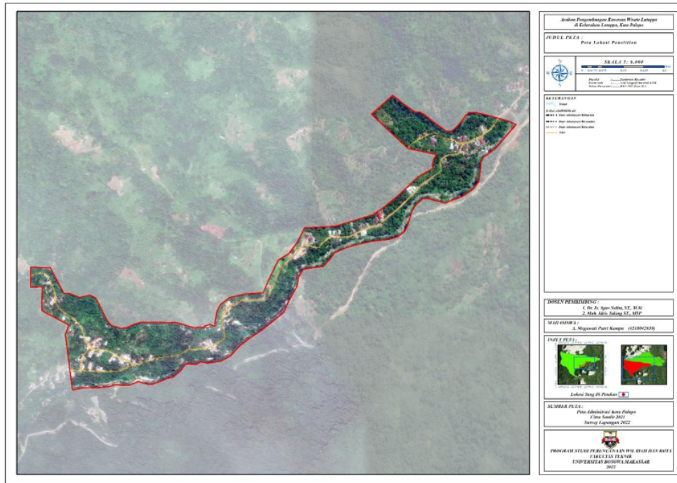
Gambar 1. Peta Lokasi Penelitian Kawasan Wisata Latuppa

merupakan salah satu dari 4 kelurahan yang ada di Kecamatan Mungkajang dengan luas wilayah 18,33 km 2 . Terkait dengan batasan wilayah administrasi Kelurahan Latuppa yaitu sebelah utara berbatasan dengan Kelurahan Kambo, sebelah timur dan sebelah selatan berbatasan dengan Kelurahan Peta, dan sebelah barat berbatasan dengan Kecamatan Bastem Kab. Luwu.