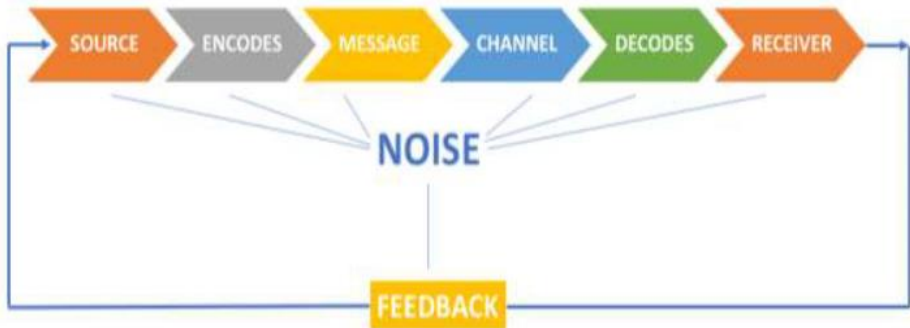
Gambar 6.2. Model Komunikasi Wilbur Schramm

tujuan pendidikan. Model komunikasi pendidikan digambarkan seperti di bawah ini.