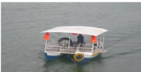
Gambar 2. Wisata Air di Bendungan Bili-Bili

Untuk masyarakat yang tidak memiliki kapal, usaha homestay menjadi peluang utama dalam menambah pendapatan. Masyarakat membangun homestay di rumah-rumahnya sendiri sehingga mirip seperti rumah kost atau membangun rumah lain di tempat yang dekat maupun jauh dari rumahnya. Tidak jarang ketika akhir pekan, beberapa masyarakat bahkan menyewakan rumah tinggalnya sendiri kepada para wisatawan sementara pemilik