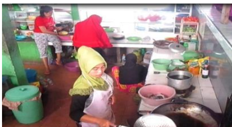
Gambar 3: Wisata Kuliner di Kawasan Bendungan Bili-bili

Masyarakat Kabupaten Gowa memanfaatkan bendungan Bili-bili sebagai