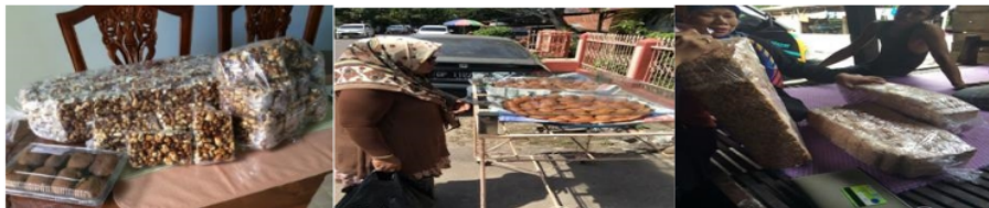
Gambar 1. Produksi Industri kuliner Rumah Tangga

Industri kuliner tradisional di Kecamatan Panca Rijang memiliki peran yang sangat penting dalam perekonomian daerah mengingat berbagai potensi yang melekat pada industri ini. Potensi tersebut antara lain mencakup jumlah dan penyebarannya, penyerapan tenaga kerja, penggunaan bahan baku lokal, efek yang dihasilkan dari industri kuliner pada beberapa sektor ekonomi lainnya, seperti: usaha pemasok bahan baku, peningkatan pendapatan daerah dan penciptaan inkubator-inkubator bisnis lainnya yang ada hubungannya dengan industri kuliner tradisional rumah tangga tersebut [3][4] . Selain itu, industri kuliner tradisional ini banyak menggunakan bahan baku dan sumber daya manusia dari lingkungan terdekat (di samping tingkat upah yang murah juga pengadaan bahan baku relative terjangkau) memungkinkan biaya produksi dapat ditekan. Harga jual relatif murah sehingga masyarakat kelas menengah dan bawah atau masyarakat berpendapatan rendah merupakan lahan pasar potensial yang memberikan peluang bagi pengembangan industri kuliner tradisional rumah tangga [3] .