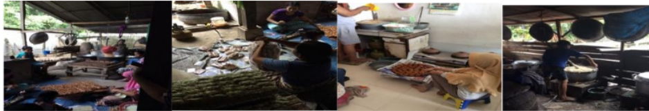
Gambar 3. Proses Produksi