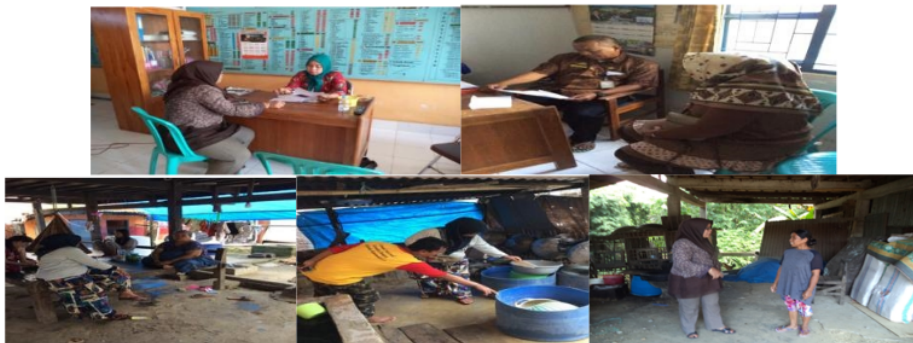
Gambar 2. Diskusi dengan Pelaku Industri dan Pemerintah Kecamatan Panca Rijang