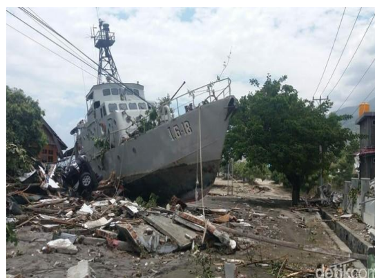
Gambar 3. Kondisi Dermaga Lanal Palu setelah terjadi Tsunami

Selain korban jiwa, gelombang tsunami yang terjadi tersebut juga menyebabkan kerusakan parah pada beberapa instalasi militer terutama yang berada di sekitar pantai (Yusuf Ali, et al. 2019). Kerusakan pada instalasi militer di Kota Palu tersebut dapat dilihat pada gambar dibawah ini: